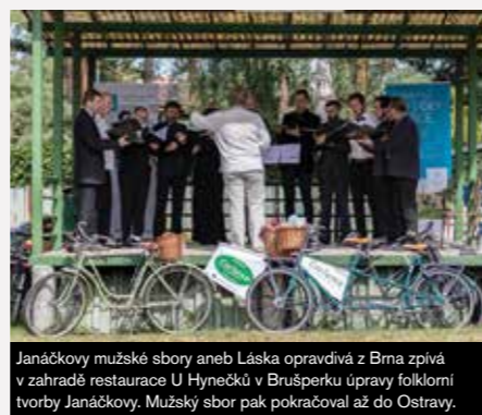
Janáčkovy mužské sbory aneb Láška opravdívá z Brna zpívá v zahradě restaurace U Hlynečků v Brušperku úpravy folklorní tvorby Janáčkovy. Mužský sbor pak pokračoval až do Ostravy.