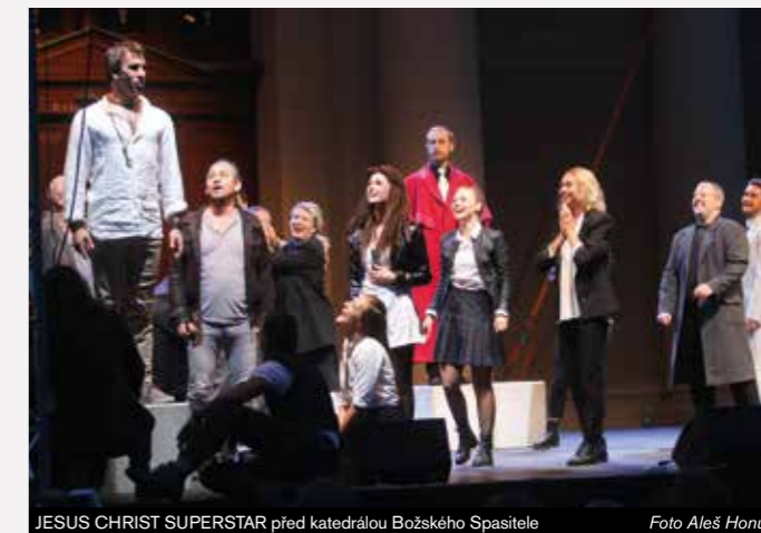
JESUS CHRIST SUPERSTAR před katedrálou Božského Spasitele

„Už při premiéře ostravské verze rockové opery Jesus Christ Superstar si mnoho lidí říkalo, že by nebylo marné někdy vyměnit scénu za skutečnost a Ježíše odehrát přímo venku před katedrálou v živém prostoru. A to se po dvou letech skutečně stalo. NDM představení přeneslo před budovu divadla v rámci festivalu Slezská lilie. A byla to událost, na kterou bude Ostrava vzpomínat ještě dlouho.“ Milan Bátor, www.ostravan.cz