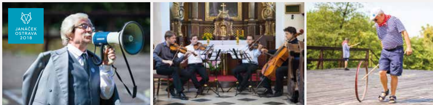
Pouť z Hukvald do Ostravy k uctění památky Leoše Janáčka pořádalo NDM spolu s projektem Janáček Ostrava 2018 v neděli 12. srpna, přesně 90 let od skladatelova skonu. V oboje pořádali velopedisté piknik, přišel i Janáček, o hudbu se postaral Český rozhlas Ostrava. V místním kostele zahrál Benda Quartet smyčcové úpravy Janáčkovy cyklu PO ZAROSTLÉM CHODNÍČKU.