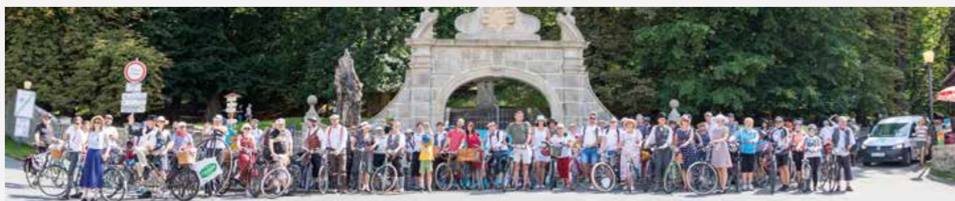
Více než stovka velopedistů vyrazila směr Ostrava z Hukvald po 13. hodině. Užívali si spolu s dalšími cyklisty krásného počasí i Janáčkovy hudby na čtyřech dalších zastávkách.