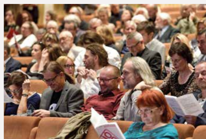
Ve dnech 24. – 28. června 2018 proběhlo čtvrté bienále festivalu NODO (Dny nové opery Ostrava / New Opera Days Ostrava). Nejočekávanější produkcí byla světová premiéra šestinotónové opery Aloise Háby PŘIJÍ KRÁLOVSTVÍ TVÉ, op. 50, kterou zhlédli např. skladatelé Petr Bakla a Petr Cígler a básník Petr Hruška.