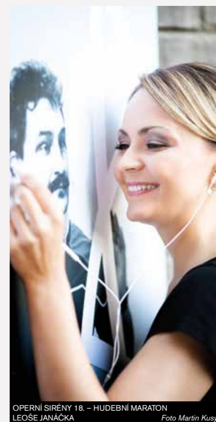
OPERNÍ SIRÉNY 18. – HUDEBNÍ MARATON LEOŠE JANÁČKA