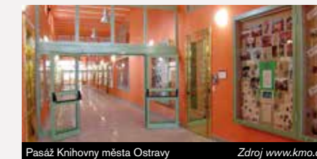
Pasáž Knihovny města Ostravy

Výstava fotografií v pasáži Knihovny města Ostravy – Operní sirény