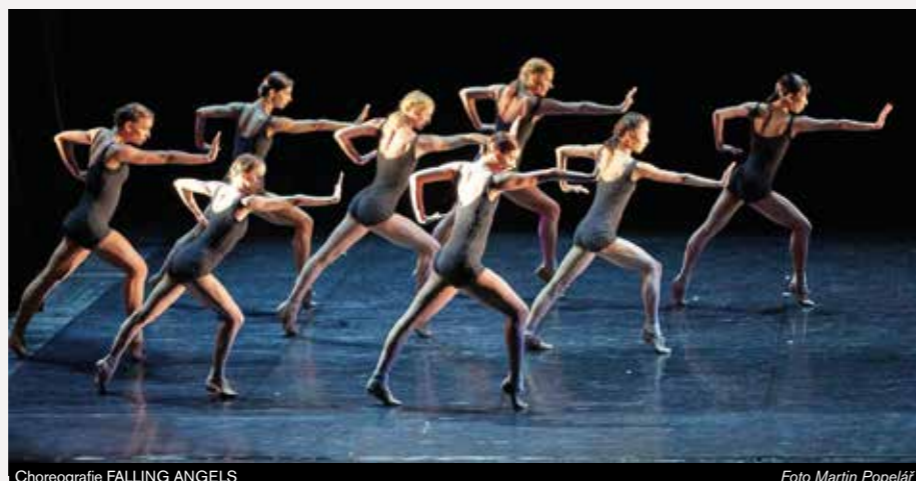
Choreografie FALLING ANGELS

Ozdobou jednoho z večerů 11. ročníků festivalu TANECVALMEZ byla letos choreografie Falling Angels (z baletu DVA SVĚTY / JEDEN SVĚT ), se kterou soubor baletu NDM hostoval 6. května v Městském divadle Zlín. Třetí festivalový večer patřil třem souborům – SpellBound Contemporary Ballet z Itálie s choreografiemi How to Pray a Formami , Pražskému komornímu baletu a jejich černé grotesce Chvilka POEzie a našim tanečnicím se slavnou choreografií Jiřího Kyliána. (pm)