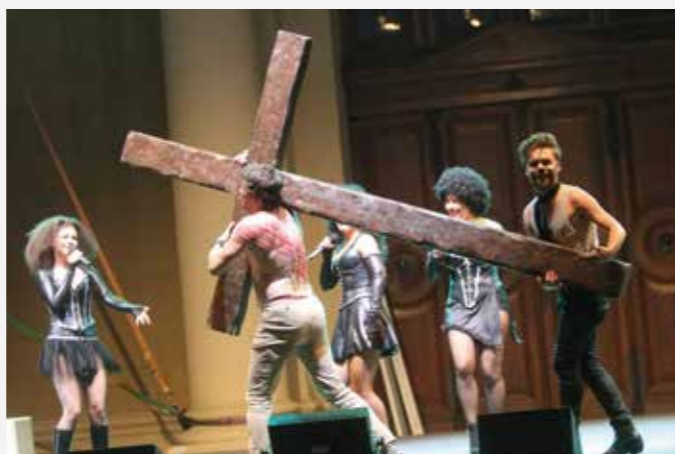
Dne 9. června 2018 jsme si pro vás přichystali ve spolupráci s festivalem Slezská lilie výjimečné představení. Před katedrálou Božského Spasitele na náměstí Msgre. Šrámka jsme uvedli s velkým úspěchem divadelně koncertní verzi rockové opery JESUS CHRIST SUPERSTAR.