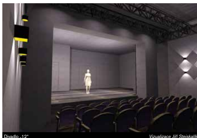
Divadlo - 12*