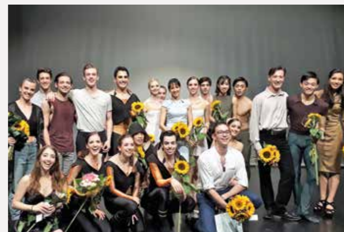
Dne 20. června se v představení s názvem MYSLÍM, TEDY JSEM poprvé jako tvůrci choreografií (nikoli jen jako tanečníci) představili na scéně Divadla Antonína Dvořáka ti členové ostravského baletního souboru, kteří v sobě našli odvahu a ctízádnost předvést svůj kreativní potenciál ve vlastní autorské tvorbě.