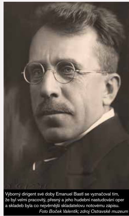
Výborný dirigent své doby Emanuel Bastl se vyznačoval tím, že byl velmi pracovitý, přesný a jeho hudební nastudování oper a skladeb byla co nejuvěrnější skladatelovu notovému zápisu.

(19. května 1874 Praha – 1. ledna 1950 Plzeň) Volba Emanuela Bastla jako prvního šéfa opery NDM byla ze strany ředitele Václava Jiříkovského logická a příhodná. Emanuel Bastl byl důkladným a svědomitým dirigentem, který již v Ostravě působil a poznal nároky zdejšího obecenstva a možnosti malého, plně neobsazeného operního souboru. Podle toho také začal formovat první stěžejní dramaturgii věnující se především národní opeře a původním novinkám, na niž navázali později například Jaroslav Vogel nebo Zdeněk Chalabala. Vedle národních skladatelů Smetany, Dvořáka a Fibicha