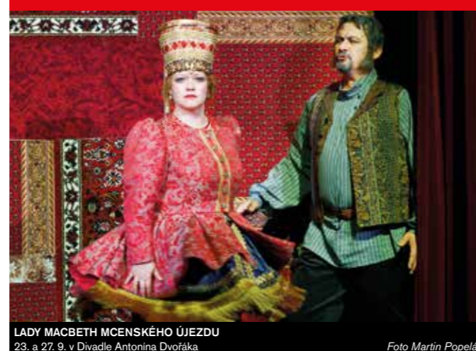
LADY MACBETH MCENSKÉHO ÚJEZDU 23. a 27. 9. v Divadle Antonína Dvořáka