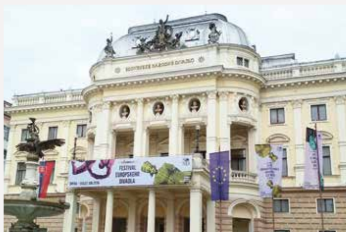
Inscenace LADY MACBETH MCENSKÉHO ÚJEZDU v provedení opery NDM zaznamenala velký úspěch při svém hostování v Bratislavě na mezinárodním festivalu Eurokontext.sk. Inscenace se pyšní hned několika vynikajícími ohlasy ze strany odborné slovenské kritiky.