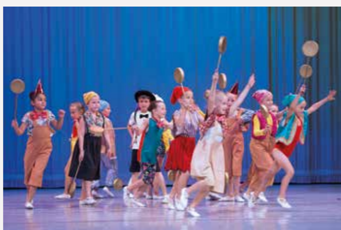
Baletní studio NDM má za sebou tradiční závěrečný koncert, který se letos uskutečnil v neděli 24. června 2018 od 11.00 a 14.00 hodin.