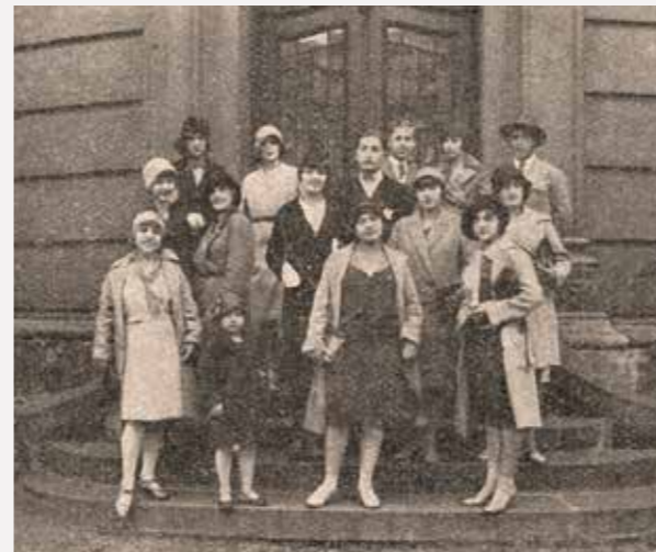
První členové baletního souboru a operního orchestru. Většina byla rekrutována z divadelní společnosti Národního domu v Moravské Ostravě, která zde působila ještě před založením Národního divadla moravskoslezského.